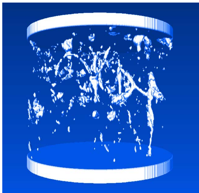
Mittels Computertomograph sichtbar gemachte Grobporen. Gesunder Boden (links) und verdichteter Boden (rechts).