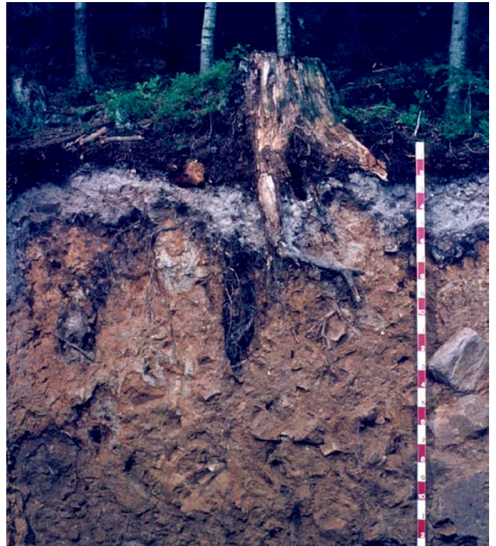
Bodenprofil Guberwald (Gemeinde Schwarzenberg, LU): Dieser Standort wurde als teilweise kritisch eingestuft. Gut erkennbar ist der durch die sauren Niederschläge stark ausgebleichte Bereich.

Wie stark ist der Waldboden in der Zentralschweiz von der Versauerung betroffen? Die Kantonale Bodenüberwachung (KABO) Zentralschweiz hat im Jahr 2011 entsprechende Bodenproben ausgewertet (total 703 Proben von 115 Standorten).