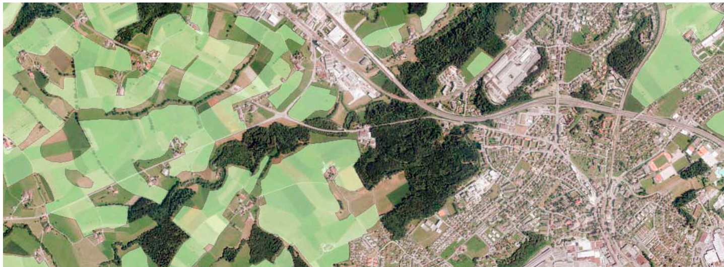
Westlich von Emmen und dem Riffigwald: Die hellgrün markierten Flächen sind gesicherte Fruchtfolgefleichen ( www.geoportal.lu.ch ).

Die Schweizer Landwirtschaft soll auch in Krisenzeiten genügend Nahrungs- und Futtermittel produzieren können. Deshalb gibt der Bund den Kantonen vor, wie viele Hektaren ackerfähigen Bodens sie dauerhaft erhalten müssen. Der Kanton Luzern nimmt diesen Auftrag – wie andere Kantone – wahr und wird diesen Flächen bei raumwirksamen Tätigkeiten vermehrt Beachtung schenken.