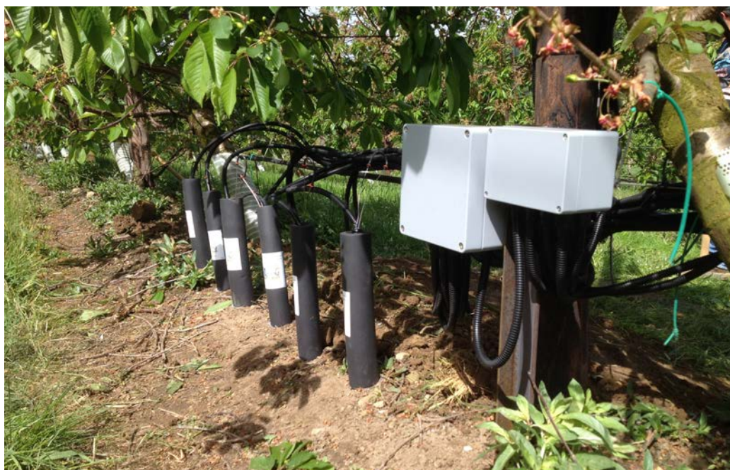
Messstation in Kirschenplantage