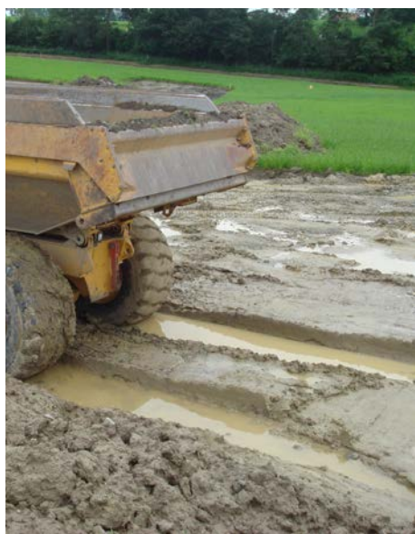
Die tiefen Fahrspuren zeigen es: Hier wurde der Boden bei nassen Verhältnissen mit einem zu schweren Gerät befahren.