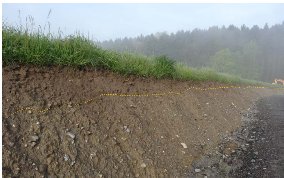
Gelungenes Beispiel einer Rekultivierung: Die gestrichelte Linie markiert die Grenze zwischen Unter- und Oberboden.