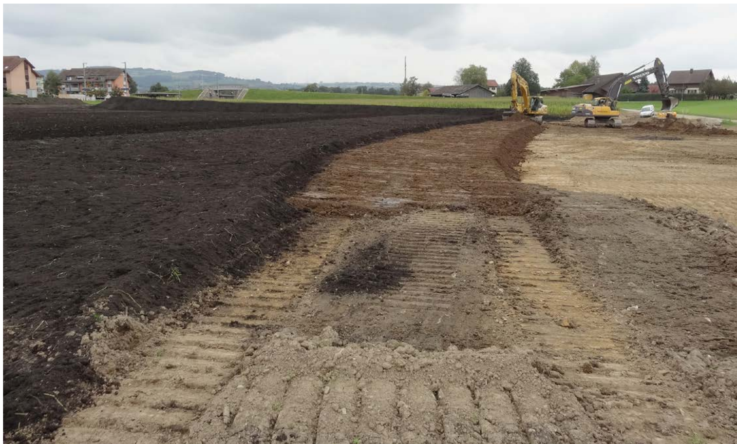
Korrektur Aufbau eines Bodens: Untergrund (rechts), Unterboden (Bildmitte) und Oberboden (dunkelbraun) werden aufeinandergeschichtet.

Bei vielen baulichen Aktivitäten muss Boden abgetragen und später wieder angelegt werden. Bei solchen Rekultivierungen kann der Boden Schaden nehmen. Unter anderem ist es wichtig, ihn bei der Folgebewirtschaftung zu schonen. Die Ergebnisse einer Untersuchung von 18 Rekultivierungen in der Zentralschweiz sind ernüchternd.